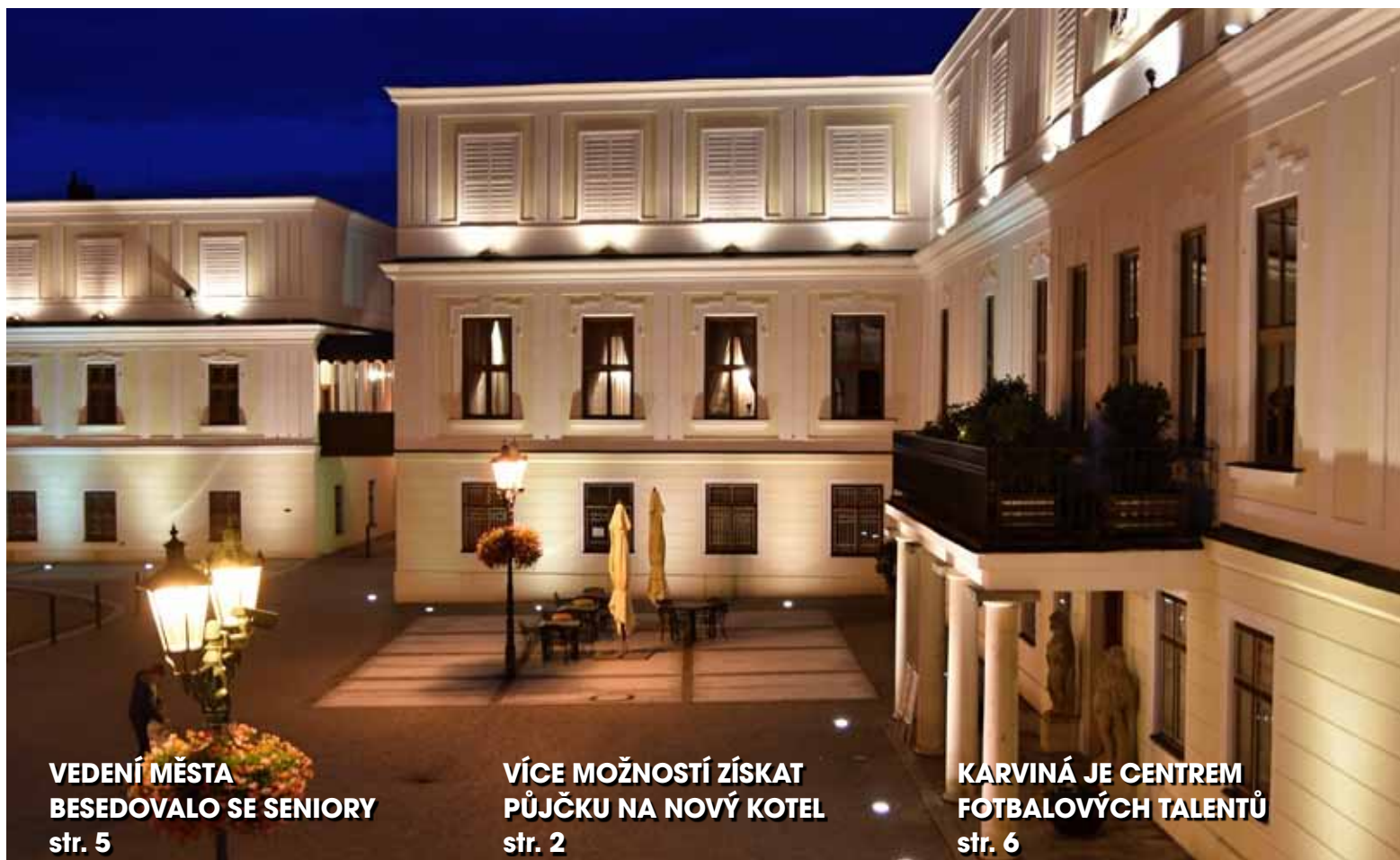
VEDENÍ MĚSTA BESEDOVALO SE SENIORY str. 5